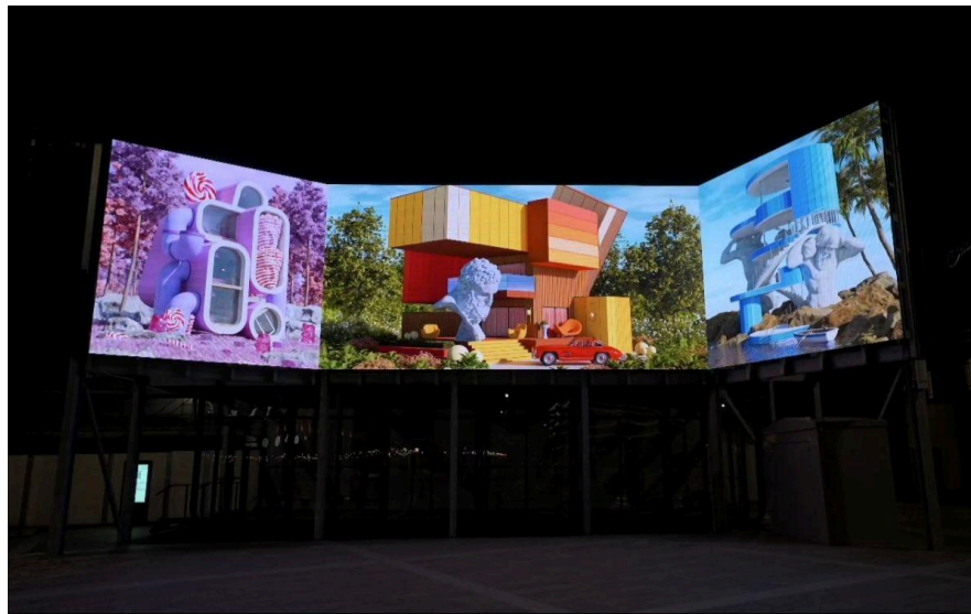
Sunderland, UK 2025

Schermi digitali con cornice personalizzabile per adattarsi al meglio all'opera stessa e alla casa che è pronta ad accoglierla.