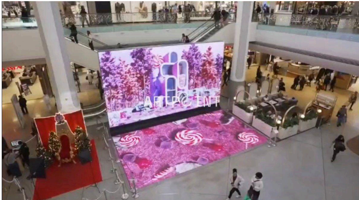
Nizza, Francia 2024

Un'opera d'arte che unisce la fruizione di un quadro tradizionale alla potenza espressiva del digitale.